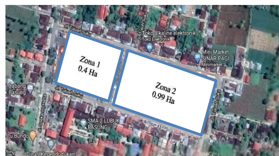
Gambar 1. Lokasi Tapak