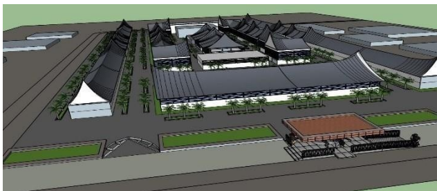
Gambar 4. Perspektif.