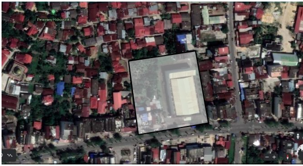
Gambar 1. Lokasi Tapak

Berdasarkan RTRW Kabupaten Siak 2014, pasal 51 ayat 3 huruf b tentang pengembangan sarana dan prasarana pendukung kota, maka site yang terpilih terdapat pada Jl. Raya Perawang, Kabupaten Siak.