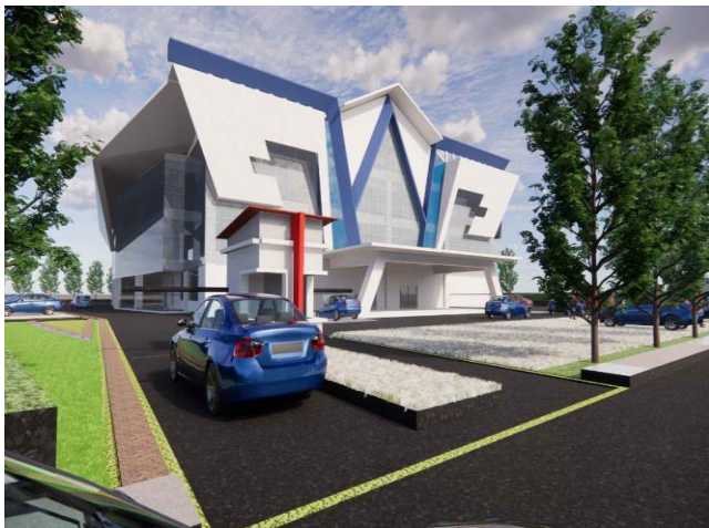
Gambar 3. Gagasan Desain Exterior