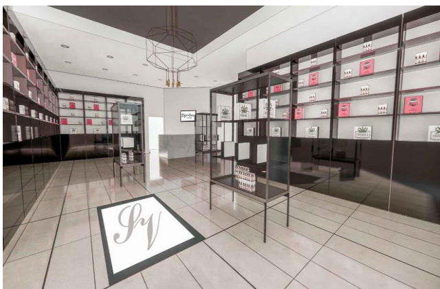
Gambar 4. Gagasan Desain Exterior