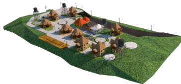
Gambar 3 . Gagasan Desain

Serta pengambilan konsep dari preseden arsitektur dari karya arsitektur terkenal dengan bentukannya yang mengikuti bentuk alam pegunungan dan danau