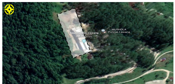
Gambar 1. Lokasi Tapak

Berdasarkan RTRW Kabupaten Agam 2010 sampai 2030 pasal 36 ayat 1 tentang rencana pengembangan kawasan pariwisata huruf f terdiri atas Kawasan pariwisata alam, pariwisata budaya, buatan atau minat khusus, maka yang terpilih terdapat pada area Puncak Lawang, Kecamatan Matur, Kabupaten Agam.