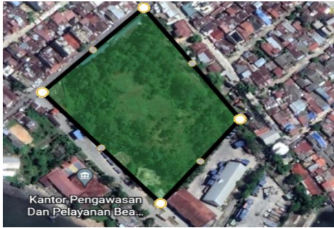
Gambar 1. Lokasi Tapak