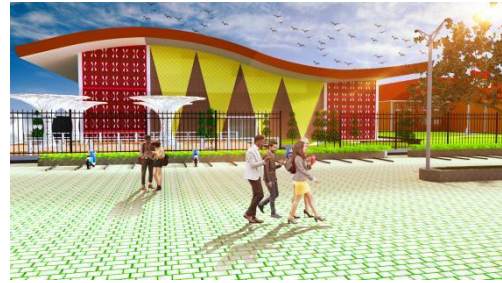
Gambar 4. Gagasan Desain Exterior