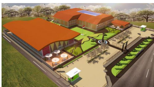
Gambar 3. Gagasan Desain