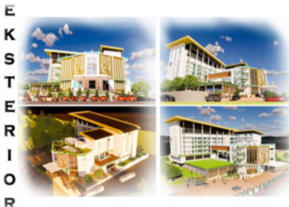
Gambar 3. Desain eksterior hotel