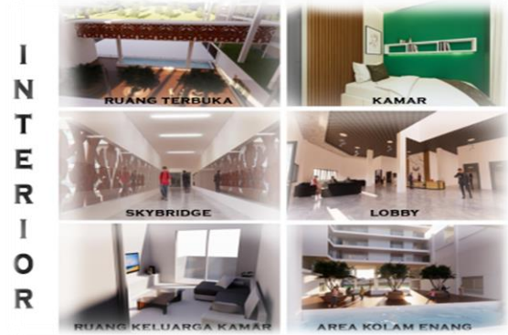
Gambar 4. Desain eksterior bangunan hotel