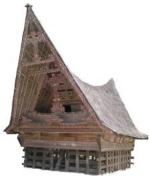
Gambar 2. Rumah Bolon

Rumah Batak mempunyai bentuk arsitektur bangunan yang menggunakan bahan kayu yang khas serta dihiasi ornamen indah yang punya makna tertentu, Rumah tradisional Batak Toba di Balige ada 2 jenis.