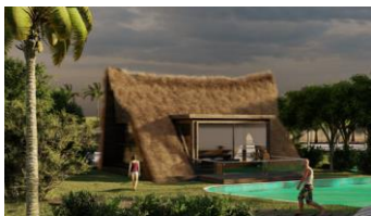
Gambar 3. Eksterior Desain