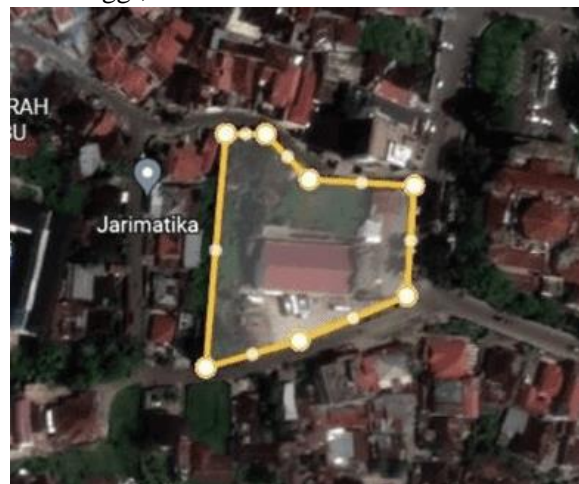
Gambar 1. Lokasi Site

Lokasi berada di Bioskop Sovia di Kota Bukittinggi,Provinsi Sumatera Barat