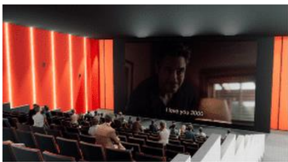
Gambar 4. Perspektif Interior 1