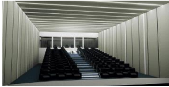
Gambar 5. Perspektif Interior 2 (Sumber : Analisa Pribadi, 2023)