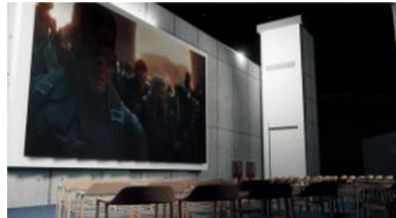
Gambar 5. Perspektif Interior 3 (Sumber : Analisa Pribadi, 2023)