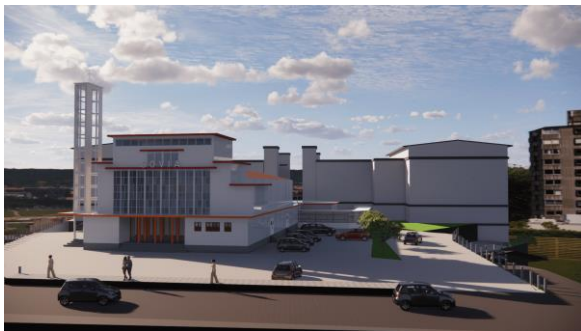
Gambar 3. Perspektif Eksterior