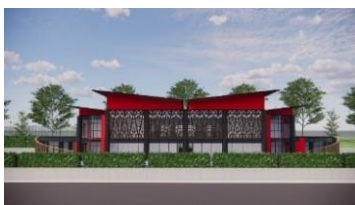
Gambar 4. Exterior Bangunan