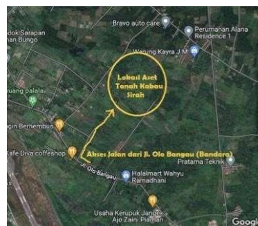
Gambar 1. Lokasi Tapak

Lokasi site dalam perancangan ini terletak di Jl. Olo Bangau, Kecamatan Batang Anai, Kabupaten Padang Pariaman, Provinsi Sumatera Barat, Indonesia.